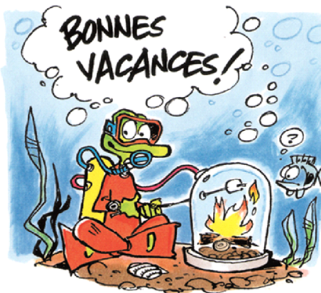
L'équipe des Débrouillards

Merci d'avoir choisi le camp des Débrouillards !