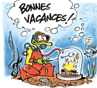
L'équipe des Débrouillards

Merci d'avoir choisi le camp des Débrouillards !